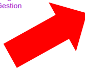
Plate-forme de gestion de rendez-vous RH